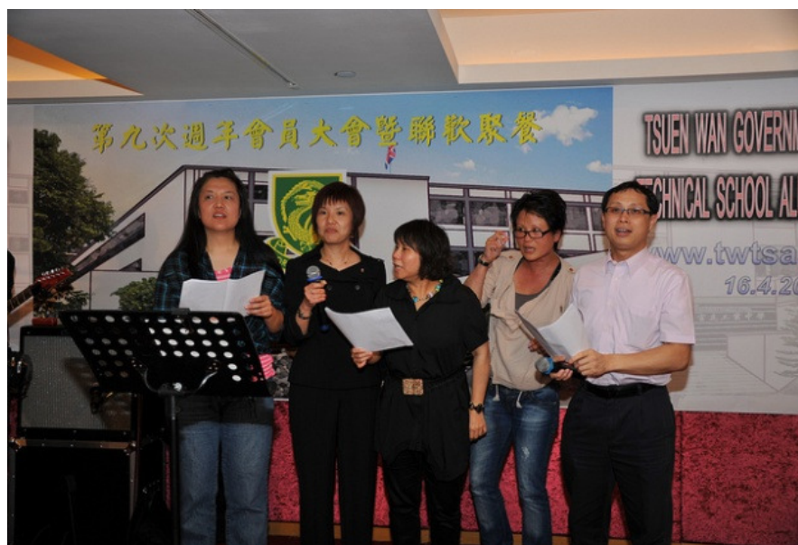
幾位 1980 年及 1981 年畢業校友 唱出荃工校歌助慶