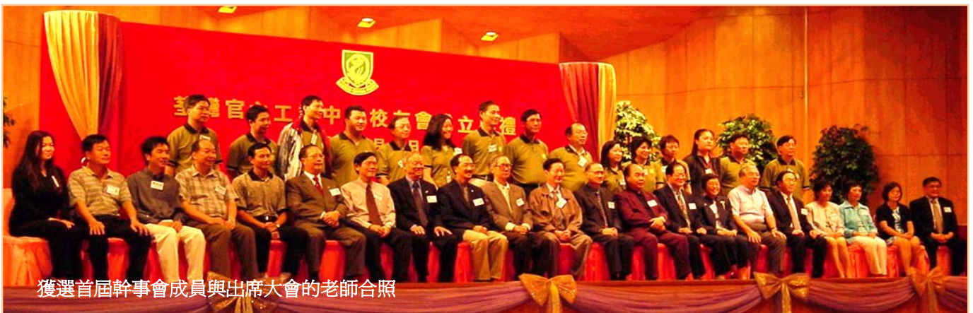
獲選首屆幹事會成員與出席大會的老師合照

我們已經坐言起行，開始了分頭工作；今後將會透過「荃情」向大家報導一切會務進展。記住！請保持在線。最後和大家拜個早年，祝大家身壯力健、萬事勝意、新年進步！