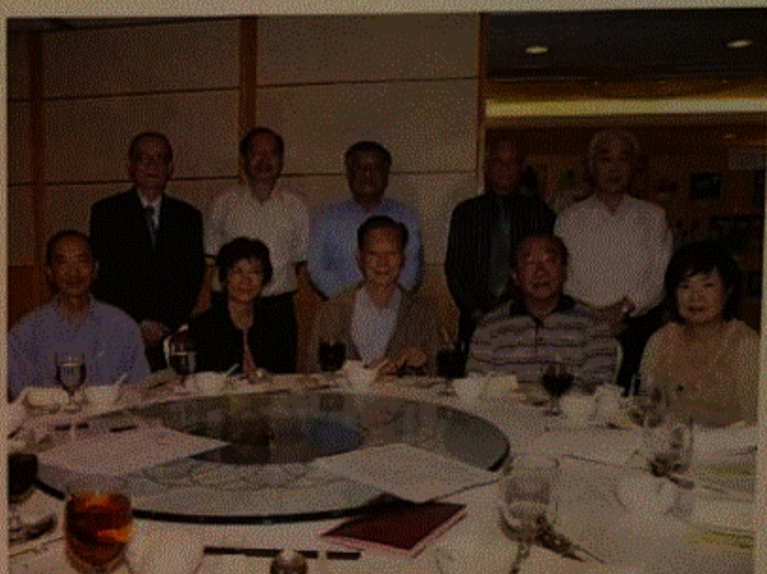
感謝老師們的支持！

到了傍晚，校友們陸續來到，見到了很多昔日同窗好友，更興奮的是多位老師來到大會支持，令現場的氣氛推至高潮，也令我們這班「已屆中年」的退役學生哥們，像是經過時光隧道，回到舊日的校園，點點滴滴全都擁上心頭。