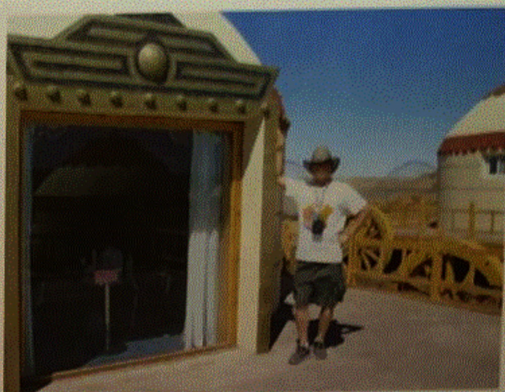
特色的戰車蒙古包

在這 14 天旅途中，參觀了湖北武漢黃鶴樓、河南少林寺、陝西兵馬俑、大雁塔、明城牆、鐘鼓樓、湖北赤壁、湖南君山島、張谷英村 (至今已存在了 500 多年)，暢遊湖南與湖北中之洞庭湖及岳陽樓，亦參觀在內蒙古包頭之成吉思汗陵，首府呼和浩特之昭君墓及五塔寺等地方。