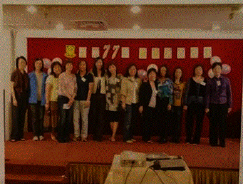
C 班同學喜愛千個太陽

抽獎過後，已是 11 時許了。果然快樂的時間過得特別快，又要與老師、同學講拜拜。真是感激一班熱心的同學發起籌辦這個 30 週年紀念活動，亦多謝老師同學的踴躍參加。我當今的心情，或者可用下列 32 個字來總結。