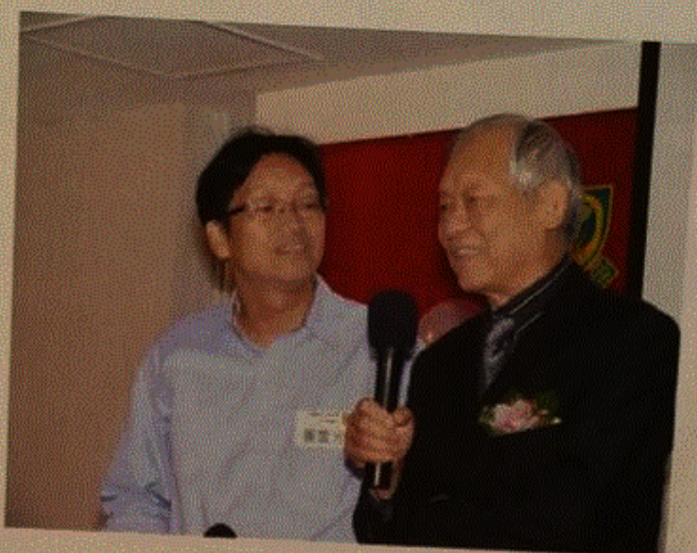
老師與學生真情對話