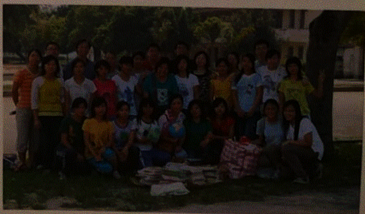
今年8月書簿捐贈活動與懷集二中同學合照

回想多年的義務工作，內地助學畢竟是一件很費心力和耗時的事工。多位校友自委員會成立以來，一直付出很多的時間和心血，雖然有些同志礙於事忙而暫時離開，也有中途加入的熱心校友和其他朋友，但是在這漫長的助人路上，我們實在需要更多支援及新的動力，好讓我們的工作得以順利開展。在此我誠心呼籲你和你的親友加入我們的委員會！