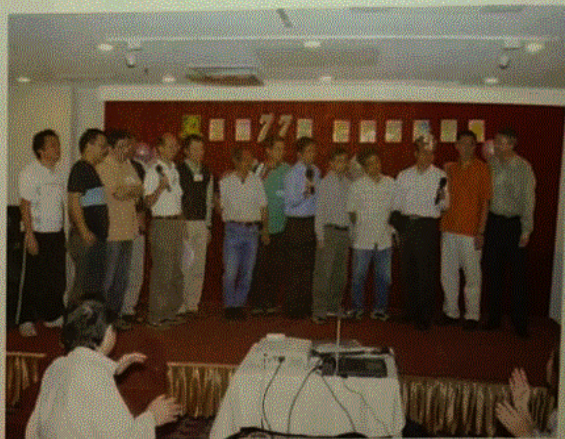
B 班同學則有酒今朝醉