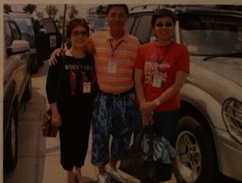
內蒙偶遇紅衣小師妹

在標題上我用「外遇」一字，各同學請勿戴上有色眼鏡去看，我這裏是指「外」地之偶「遇」而已。記得去年我參加雲南之遊後，在「荃情」投了一小段旅遊樂趣稿，有一小師妹看過，剛巧該位小師妹也有參加此次內蒙自駕遊，直到最後兩天午膳完畢，該位小師妹才走近來問我是否荃工校友會同學，我細問之下，才知她是 1973 年畢業的荃工校友。若沒有「荃情」，大家彼此各不相識。但我是「大頭蝦」，只和小師妹影了兩張相片，並沒有向師妹請教芳名，還望她看到這篇文章後能再賜教芳名，更望她能撥出時間參與校友會各項事務。