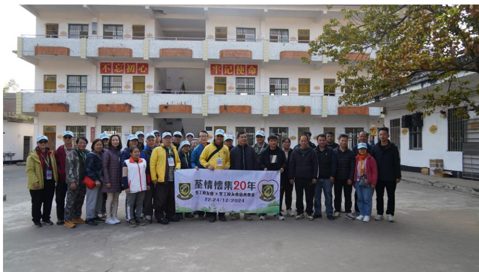
荃情懷集20年探訪團與新寧小學校長老師拍照留念