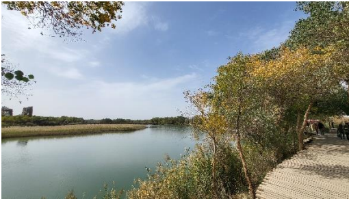
紅海灣胡楊林景區