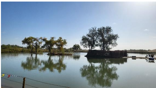
陽光與水的合作(一)