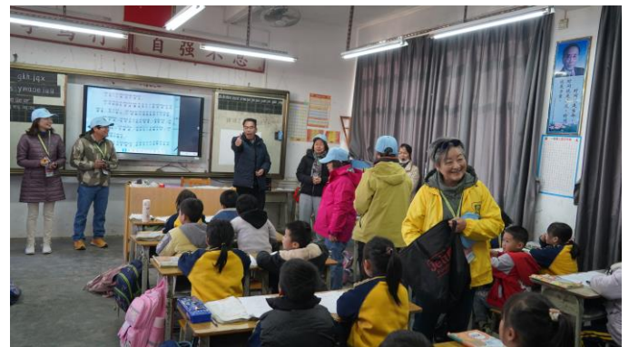
探訪團探望光明小學學生