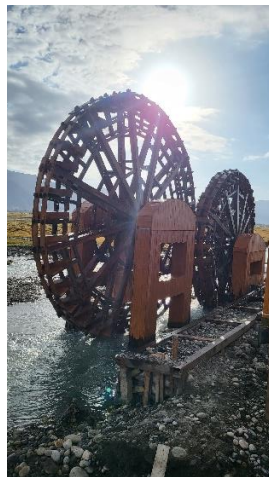
金草灘陽光與水的合作