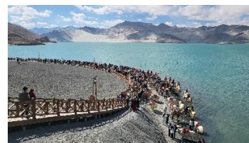
白沙湖的高角度(人海)