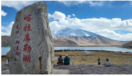
喀拉庫勒湖的碑石