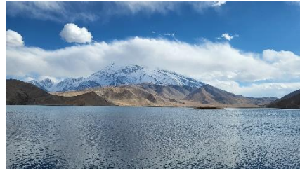
喀拉庫勒湖的山與水

由喀什去塔縣玩了一天，然後由塔縣返回喀什，又玩多一天，回程時經過中國歷史上最著名的三大石頭城之一的「石頭城遺址」，及阿拉爾國家濕地公園的「金草灘」。