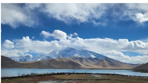
喀拉庫勒湖的廣角度