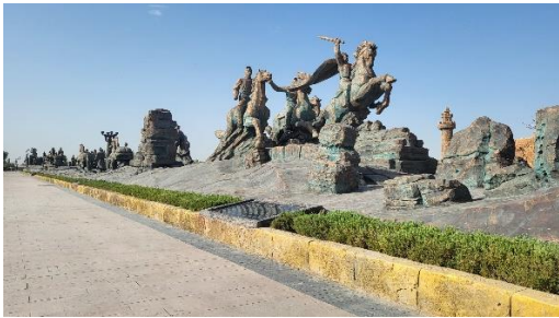
達瓦昆沙漠旅遊風景區