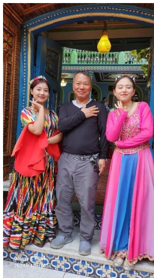
古麗的家維吾爾族靚女