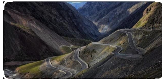
獨庫公路(網上圖片)