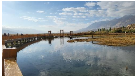
金草灘的橋與倒影(二)