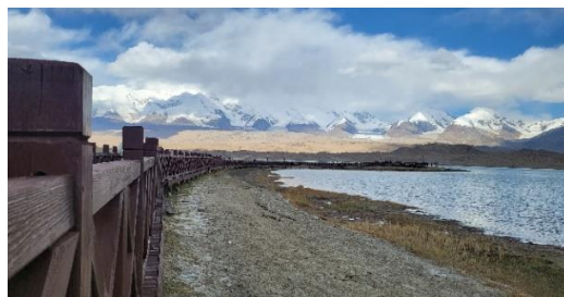
喀拉庫勒湖的近與遠