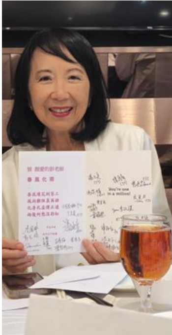
同學自製心意咭送給彭老師