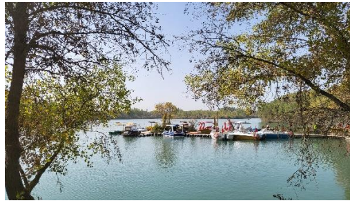
金胡楊國家森林公園