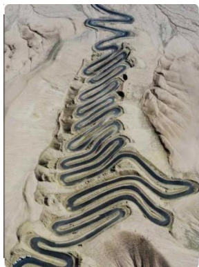
盤龍古道(網上圖片)