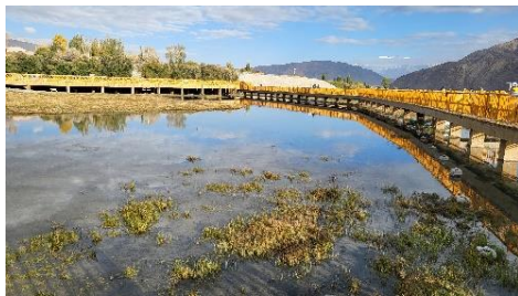
金草灘的橋與倒影(一)