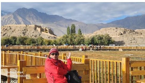
背向石頭城，人在金草灘