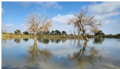
陽光與水的合作(二)