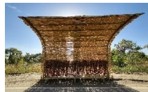
陽光的穿透力之 (一)與(二)