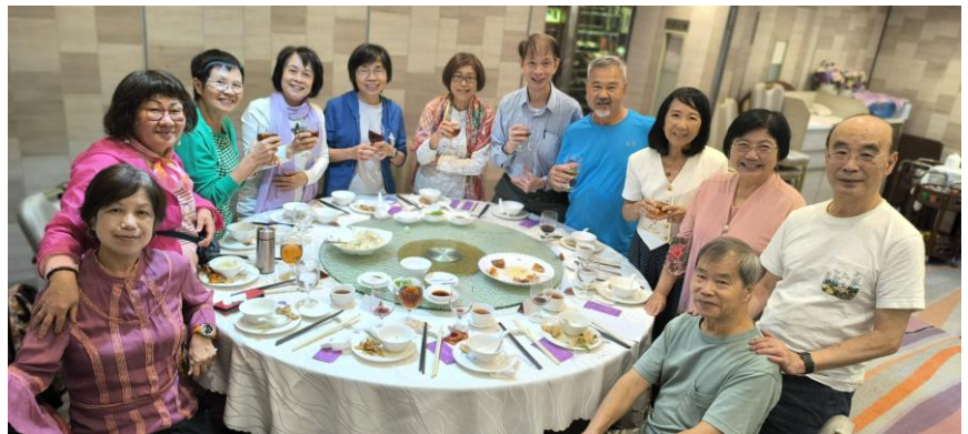
同學相聚與彭老師合照