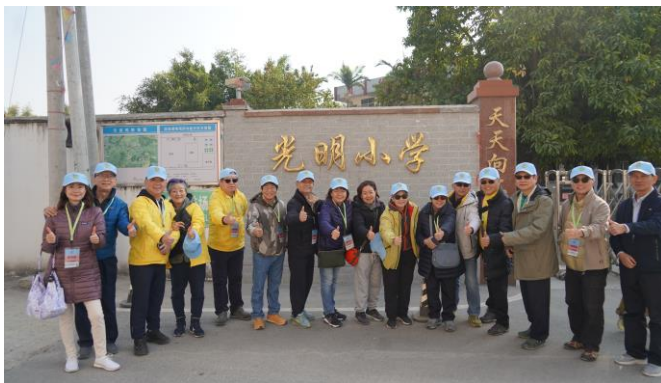
探訪團到達光明小學