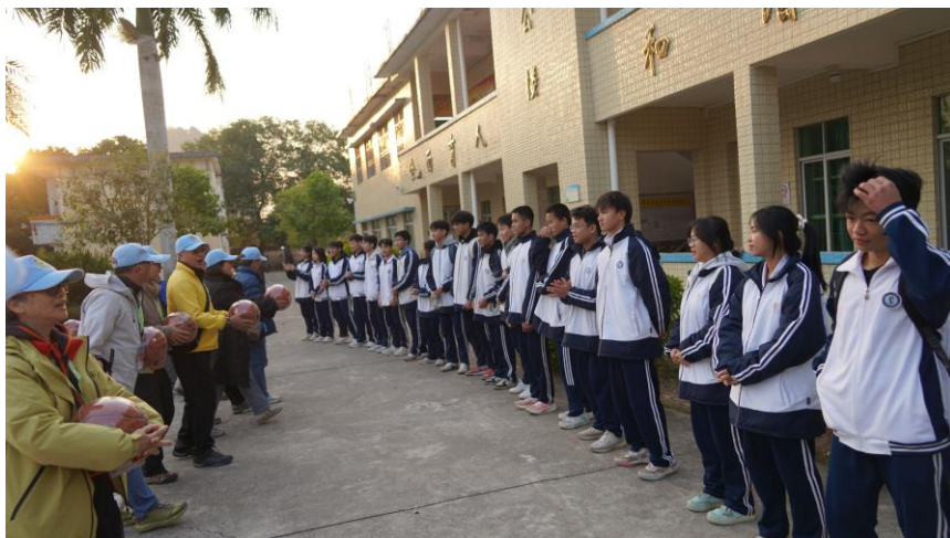
荃情懷集 20 年探訪團，向二中學生致送 20 個籃球

懷集第二中學，是荃工校友會內地助學計劃資助重點之一，自2005年開始資助有需要學生。