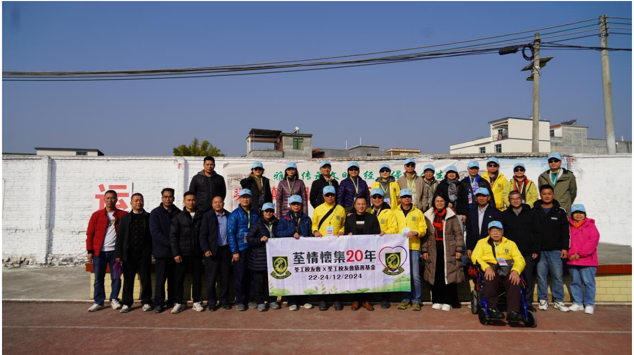
荃情懷集 20 年探訪團在光明小學實地考察

懷集縣梁村鎮光明小學去年向荃工校友會慈善基金會申請捐贈資金，支持校區擴建援助計劃，新校舍建成後可提供 700 多個學位。探訪團於 12 月 24 日到達光明小學實地考察，聽取擴建最新情況，並探望學生。