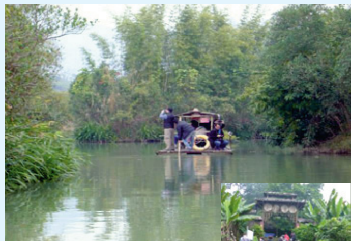
乘竹筏暢游金林水鄉

大家相約在早上八時半到達福田口岸集合出發，沿巧遇上長假期的首天，遊人如潮水般擠滿口岸，迫得大家等候了好一陣了，差不多遲了一個小時方能上車出發，直奔金林水鄉。到達水鄉時已是黃昏時份，我們分乘兩隻竹筏暢游湖上，再穿越鄉鎮中心瞭解民風，吃過一碗香甜嫩滑的山水豆腐花後，在微雨中直奔德慶盤龍峽。