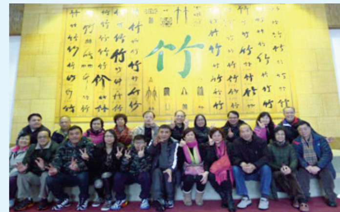
大夥兒在廣寧竹博物館合照