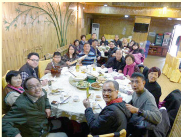
大家吃飽飽就要回家嚕！