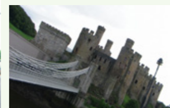
康威 – 以青口聞名的城市