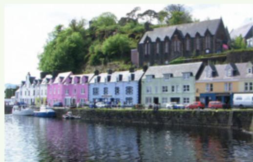
波特芝(Portree) – 斯開島北部

飛機在蘇格蘭的愛丁堡著陸。於市內玩了兩天，參觀堡壘、博物館、公園等；也嘗試坐全日通巴士遊覽市郊各處、漫步街頭、逛公司等……接著的日子，便開始租車自駕遊。往返機場，我們坐機場巴士。去租車公司取車，我們坐的士。由格拉斯哥至貝爾法斯特及都柏林至北威爾斯兩程，我們坐輪