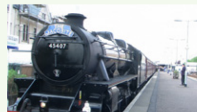
哈李波特的蒸汽火車