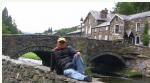
貝之律(Beddelert) – 路經北威爾斯的小鎮風光

二十八年(即 1986 年)的夏天，參加了學聯的三十三天巴士團暢遊西南歐，在英國倫敦逗留了兩天，去過溫莎堡，但現在一切印象都模糊了。今年五月中，和太太及兩對夫婦，組織了一次英倫三島三十天自駕遊，怎能不與你們分享呢？