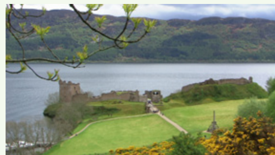
厄克特城堡 (Urquhart Castle) – 尼斯湖畔

我們差不多玩遍英倫三島，即蘇格蘭的愛丁堡(Edinburgh)、皮特洛克里(Pitlochry)、茵凡尼斯(Inverness)、尼斯湖(Loch Ness)、開斯島(Isle of Skye)、威廉堡(Fort Williams)、馬雷格(Mallaig)、快茵湖(Loch Fyne)、樂夢湖(Loch Lomond)及格拉斯哥(Glasgow)；北愛爾蘭的貝爾法斯特(Belfast)、卡域克索橋(Carrick Rope Bridge)、巨人堤道(Giant's Causeway)及倫敦德里(Londonderry)；愛爾蘭的高威市(Galway)、莫合懸崖(Cliffs of Moher)、基拿尼(Killarney)、基爾肯尼(Kilkenny)及都柏林(Dublin)；北威爾斯的喀那芬(Caernarfon)、史蘭度諾(Snowdonia)及康威(Conwy)；及英格蘭的溫德米爾(Windermere)、湖區(Lake District)、約克(York)、劍橋(Cambridge)、格林威治(Greenwich)、哥來頓(Croydon)、史雲頓(Swindon)、科茲瓦爾斯(Cotswolds)、巴斯(Bath)、巨石群(Stonehenge)、梳士巴利(Salisbury)、溫莎堡(Windsor Castle)、牛津(Oxford)、必士打村(Bicester Village)及倫敦(London)等等。